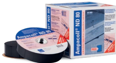
Ampacoll® ND 80: Nageldichtungen, 80 mm breit