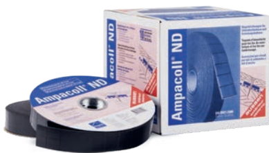
Ampacoll® ND 60: Nageldichtungen, 60 mm breit