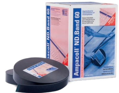
Ampacoll® ND.Band 60/80: Einseitig klebendes Nageldichtband, 60/80 mm breit