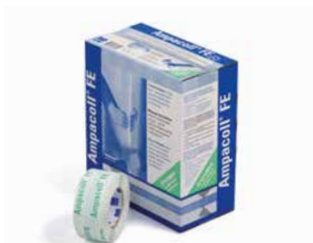
Ampacoll® FE: Nastro per la posa delle finestre per costruzioni in legno