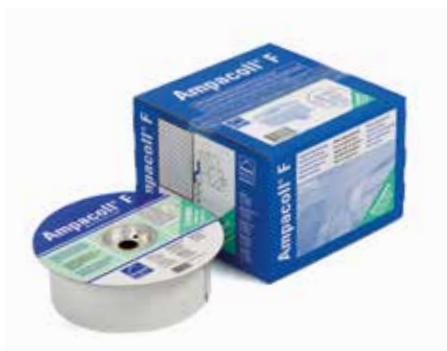
Ampacoll® F: Nastro per la posa delle finestre per costruzioni massicce