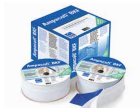
Ampacoll® BKF: Nastro per la posa delle finestre per costruzioni massicce