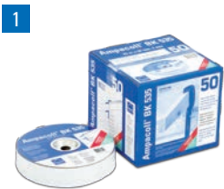
Ampacoll® BK 535: Butylkautschukband