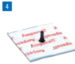
Ampacoll® Elektro u. Install: Manschetten