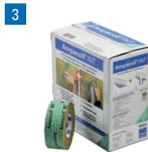
Ampacoll® INT: Acryklebeband