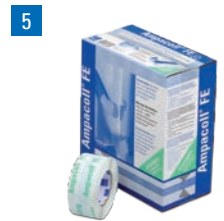
Ampacoll® FE: Fenstereinbauband