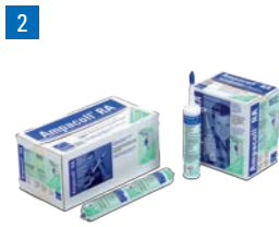
Ampacoll® RA: Flüssigklebstoff