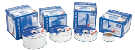
Ampacoll® BK 535 Für Durchdringungen