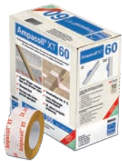
Ampacoll® XT Für Überlappungen