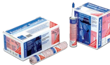
Ampacoll® Superfix Für Randanschlüsse