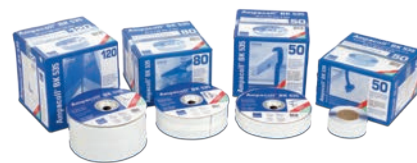
Ampacoll® BK 535 Pour les pénétrations