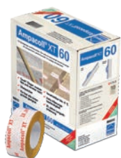
Ampacoll® XT Pour les recouvrements