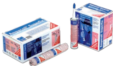
Ampacoll® Superfix Pour les bordures de raccordement