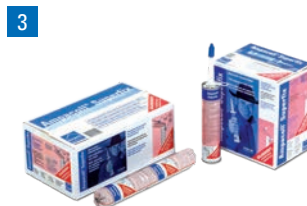
3 Ampacoll® Superfix: Flüssigklebstoff