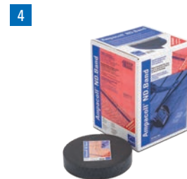
4 Ampacoll® ND.Band: Nageldichtband