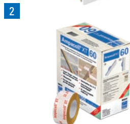
2 Ampacoll® XT 60: Acrylklebeband