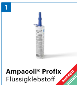
Ampacoll® Profix Flüssigklebstoff