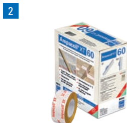
Ampacoll® XT 60 Ruban adhésif acrylique