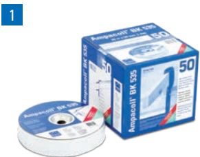
Ampacoll® BK 535 Ruban adhésif en caoutchouc butyle

4 Ampacoll® Elektro/Install Manchettes préfabriquées