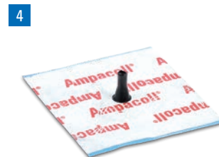
Ampacoll® Elektro/Install Manchettes préfabriquées