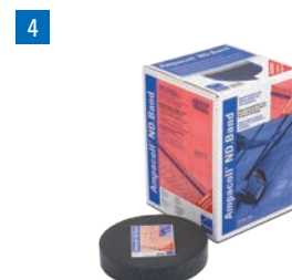
Ampacoll® ND.Band: Guarnizione per chiodi a nastro