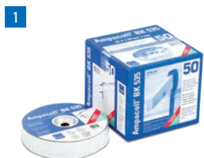
Ampacoll® BK 535: Nastro adesivo alla gomma butilica

Tyvek® Housewrap Telo di tenuta al vento