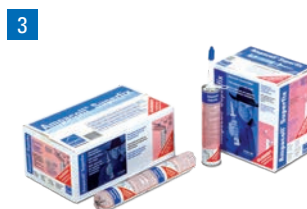
Ampacoll® Superfix: Colla liquida