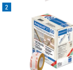
Ampacoll® XT 60: Nastro adesivo acrilico